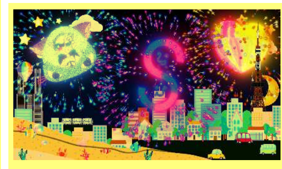
投映コンテンツイメージ