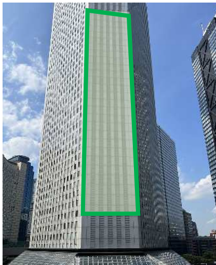
投映面（新宿住友ビル）

・自動運転車のラッピングとして新宿区立西新宿小学校5年生が描いた「20年後の西新宿にあったらよいもの」の絵及びその絵にあわせた演出を実施